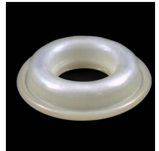
F-72 Vidinis diam. 32 mm., išorinis diam. 72 mm.