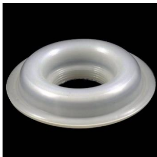
F-80A Vidinis diam. 31 mm., išorinis diam. 80 mm.