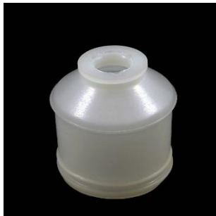
Nr. 14 A=12; B=43; C=36 mm.