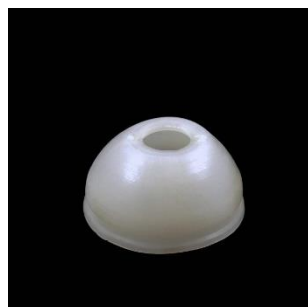
„Kalpokai” A=12; B=22; C=34 mm.