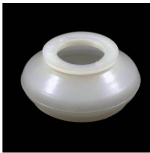
Nr. 10D A=27; B=26; C=47 mm.