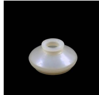
Nr. 2 STB