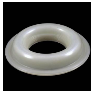
F-90 Vidinis diam. 42 mm., išorinis diam. 90 mm.