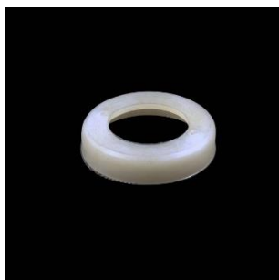
„Silentblock” apsauga A=24; B=19; C=35 mm.