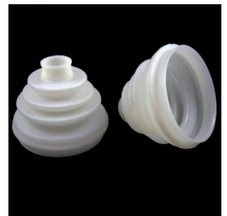
„Granatos” guma A=22; B=80; C=90 mm.