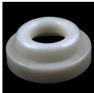
F-80B A=33; B=31; C=80 mm.