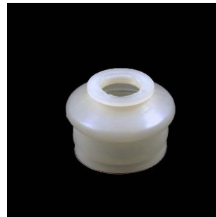
STB dviguba A=15; B=27; C=29 mm.