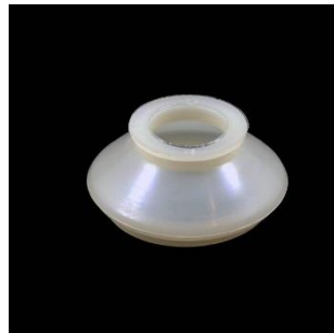
Nr. 15 A=20; B=22; C=33 mm.