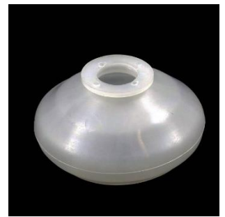
Nr. 13 A=15; B=29; C=42 mm.