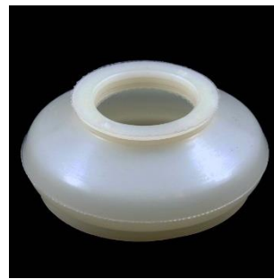
Nr. 12 A=30; B=28; C=53 mm.