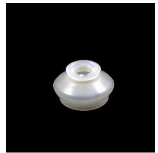
Nr. 0.5 STB