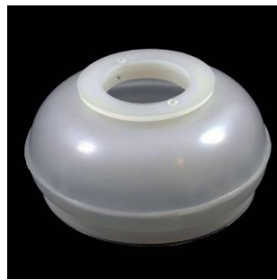
Nr. 11 A=30; B=39; C=65 mm.