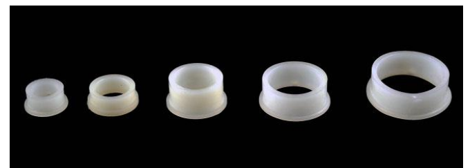
„Sijonėliai” Nr. 1–5 Nr. 1 Ø10; Nr. 2 Ø13; Nr. 3 Ø16; Nr. 4 Ø20; Nr. 5 Ø26 mm.